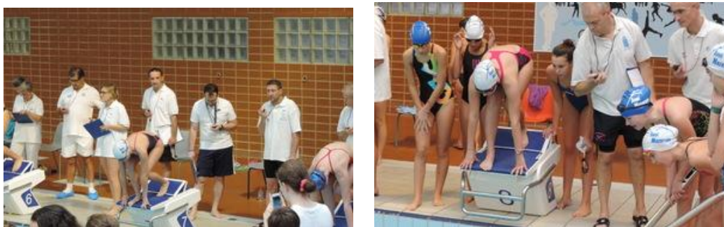
Juges et officiels : indispensables lors des compétitions...

Le bénévolat représente en année normale près du quart du budget global annuel , et est indispensable au fonctionnement du club .