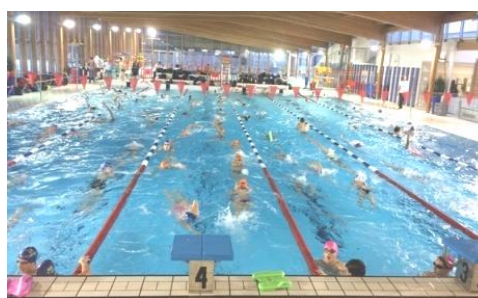
Le centre aquatique BULLE D'O de JOUE LES TOURS (bassin extérieur et bassin intérieur)